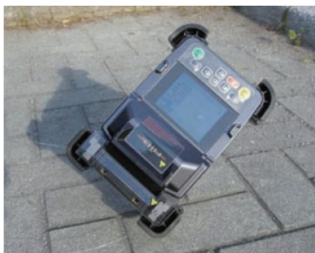
ODPORNĄ NA UPADEK